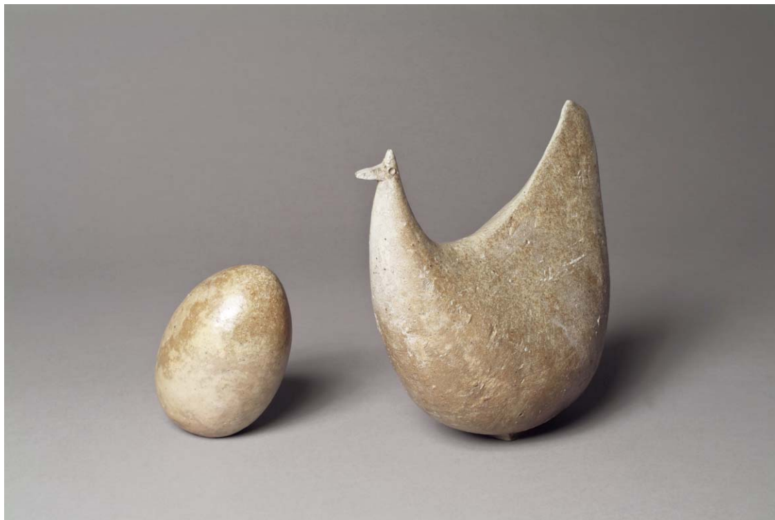
Jean Lerat Poule avec son oeuf 27 x 32 x 13.5 cm et 16 x 9 x 9 cm Grès émaillé 1962