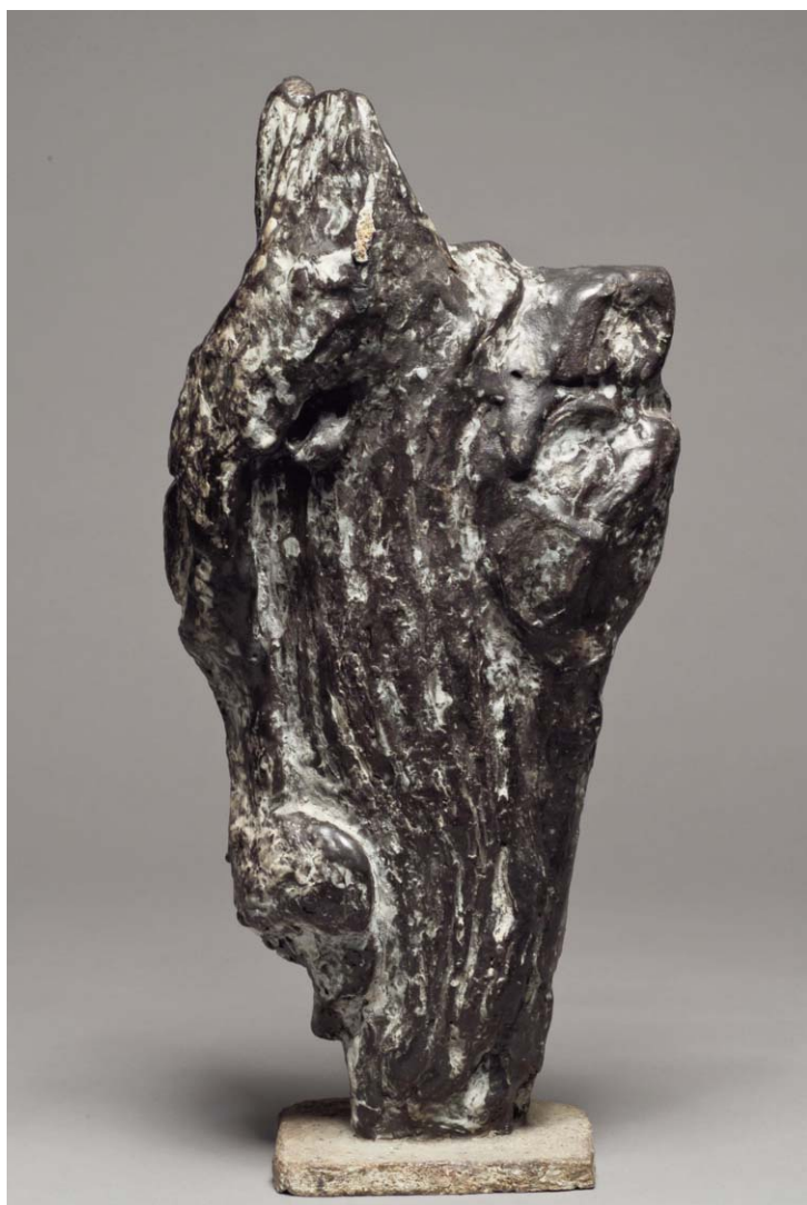
Jean Lerat Rocher Noir 53 x 25 x 14 cm Grès chamotté émaillé 1980